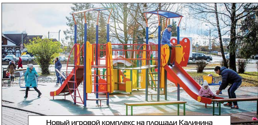
Новый игровой комплекс на площади Калинина