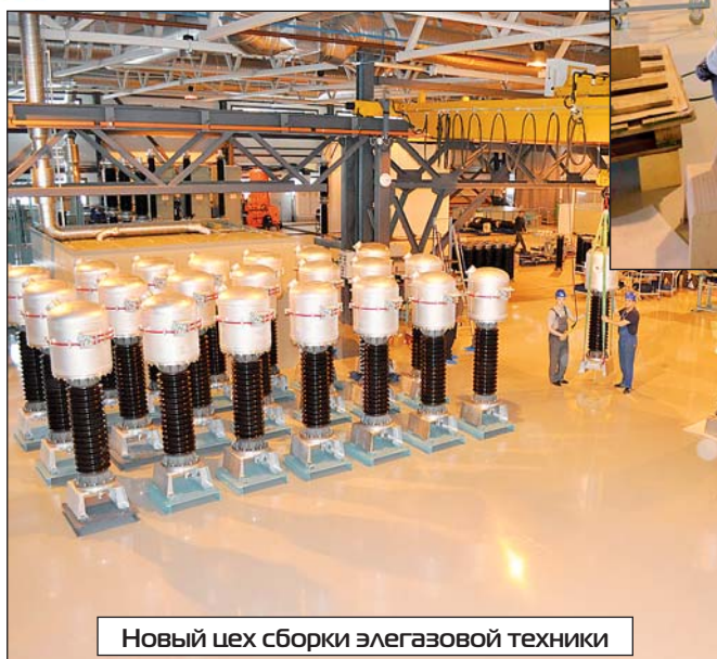
Новый цех сборки элегазовой техники