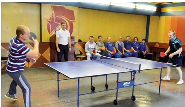
Турнир по настольному теннису памяти А.И. Лаврентьева