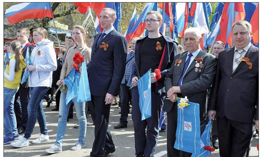
Колонна заводчан во главе с руководством предприятия на 70-летию Великой Победы