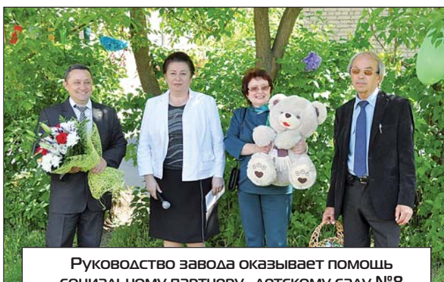
Руководство завода оказывает помощь социальному партнеру – детскому саду №8