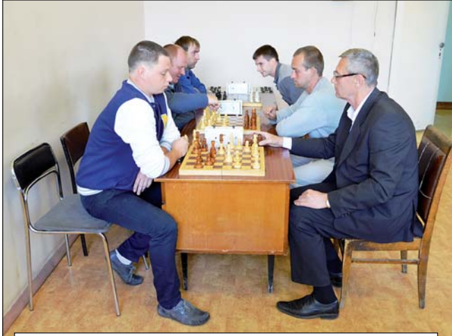
Первенство по шахматам