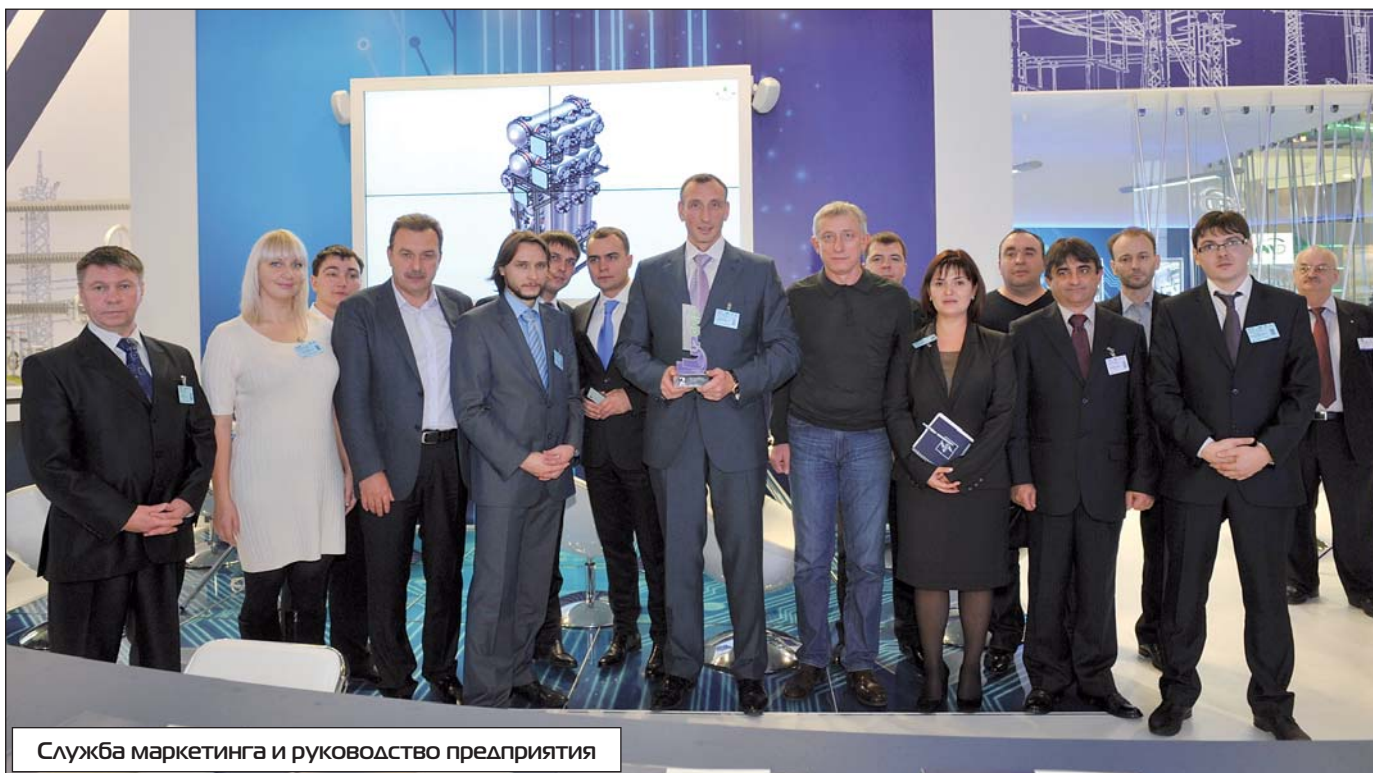
Служба маркетинга и руководство предприятия

В честь предстоящих праздников хочу пожелать всем неиссякаемой энергии, здоровья, счастья и благополучия. Уверена, что мы обладаем всеми необходимыми качествами, способностями, потенциалом и вместе «СДЕЛАЕМ МИР ЯРЧЕ!» ❄️