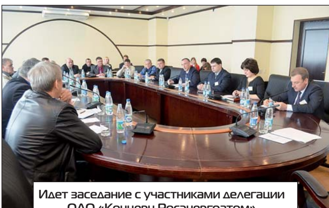
Идет заседание с участниками делегации ОАО «Концерн Росэнергоатом»