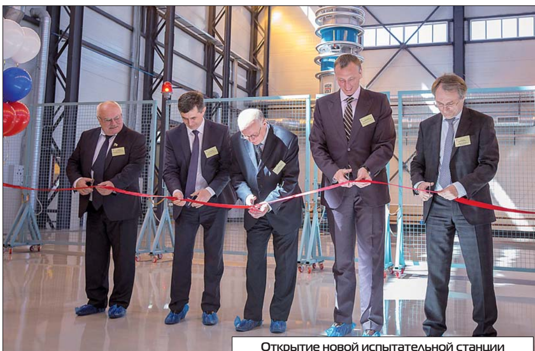
Открытие новой испытательной станции

– В этом году мы принимали участие в таком крупнейшем проек-