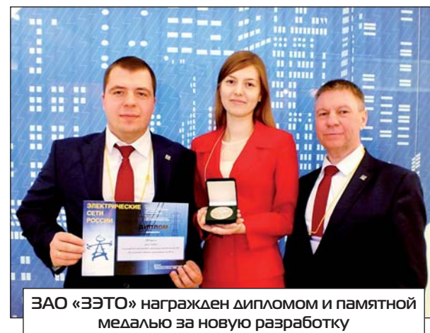
ЗАО «ЗЭТО» награжден дипломом и памятной медалью за новую разработку