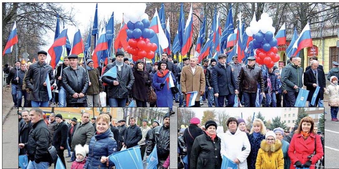
Коллектив ЗАО «ЗЭТО» принимает участие в шествии на День народного единства