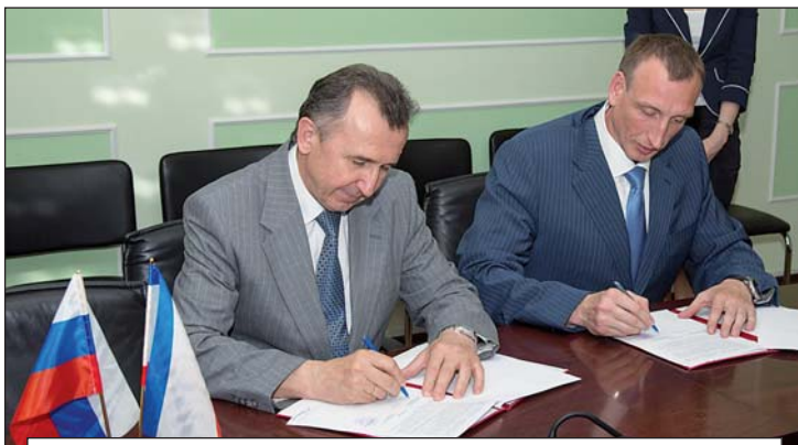
Завод активно сотрудничает с Крымскими энергетиками

Что касается земляков, то в преддверии знаменательной даты – 850-летия Великих Лук, хотелось бы пожелать, чтобы наш город с каждым годом рос и расцветал. Мы, как руководители предприятий и активные участники политической жизни, сделаем все возможное, чтобы город воинской славы стал еще более красивым и комфортным для проживания.